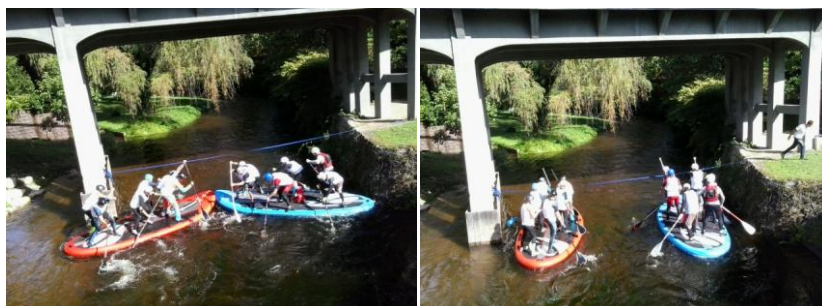
La Paddle-race sur le canal du Bourrier le 11 octobre 2015