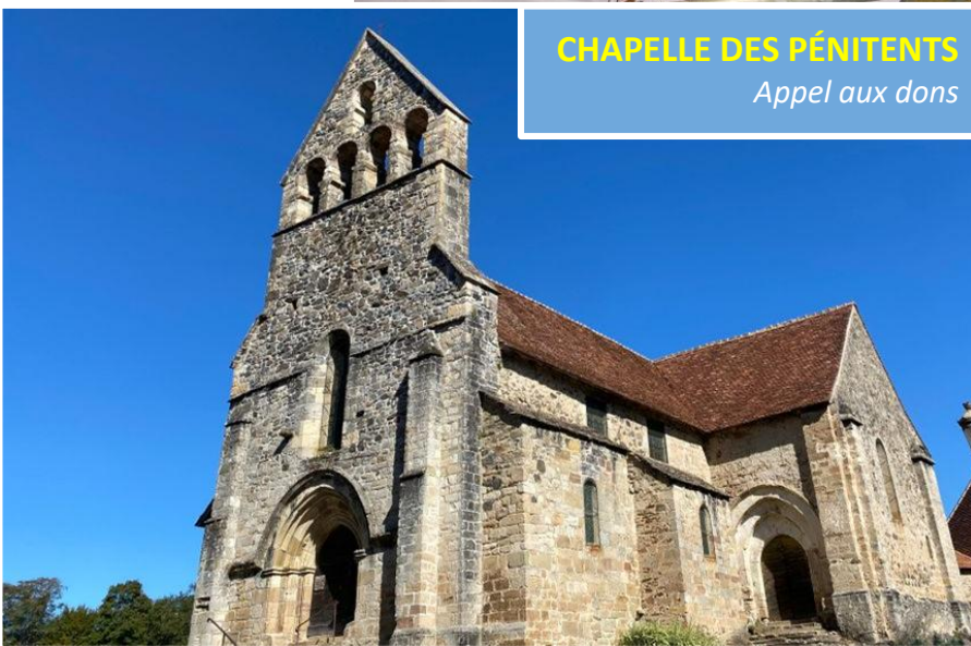
CHAPELLE DES PÉNITENTS Appel aux dons