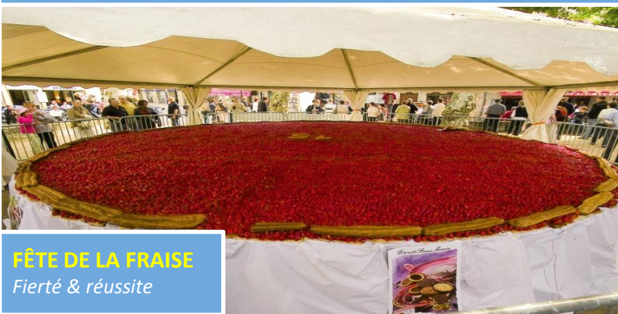
FÊTE DE LA FRAISE Fierté & réussite